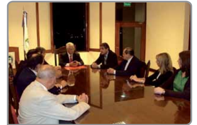
Directivos de la FACPCE y de la Universidad de Jujuy

Los convenios firmados con las universidades de Salta y Jujuy promueven un acercamiento entre las entidades para impulsar la capacitación y formación integral de los profesionales matriculados.