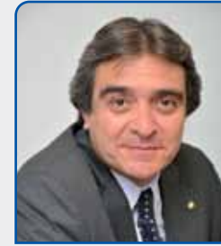
Dr. Jorge A. Paganetti

Nuestro principal objetivo es realizar un aporte efectivo al crecimiento económico de la región a través del fortalecimiento de la profesión contable, el intercambio de buenas prácticas regionales y la identificación de proyectos destinados a viabilizar su implementación.