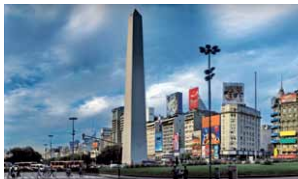
El Obelisco porteño, en Av. 9 de Julio y Corrientes. Imagen de difusión del evento CReCER