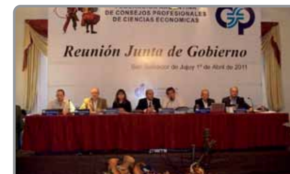
Apertura de la Junta de gobierno.