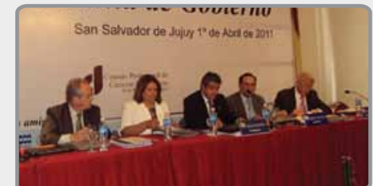
La firma del Convenio con CODECE en la Junta de Gobierno.