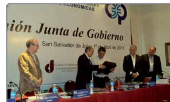
La Junta de Gobierno contó con la presencia del vicegobernador de Jujuy.