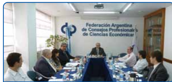
Comisión de Licenciados en Economía de FACPCE

Como se ha visto, el Licenciado en Economía actual posee aptitudes desarrolladas para el trabajo en consultoría en aspectos vinculados con las decisiones de inversión, financiamiento, planeamiento económico y estratégico, entre otros. Estas habilidades se fueron incorporando de modo complementario a las tradicionales que caracterizaban a los economistas de la primera mitad del siglo XX, sin perder el carácter científico y de investigación que lo identifica. •